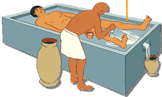
Extracción del lavado y perfumado del cadáver.