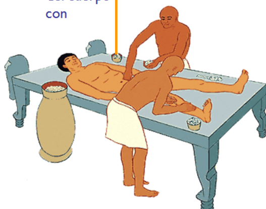
Lavado y relleno del cuerpo con